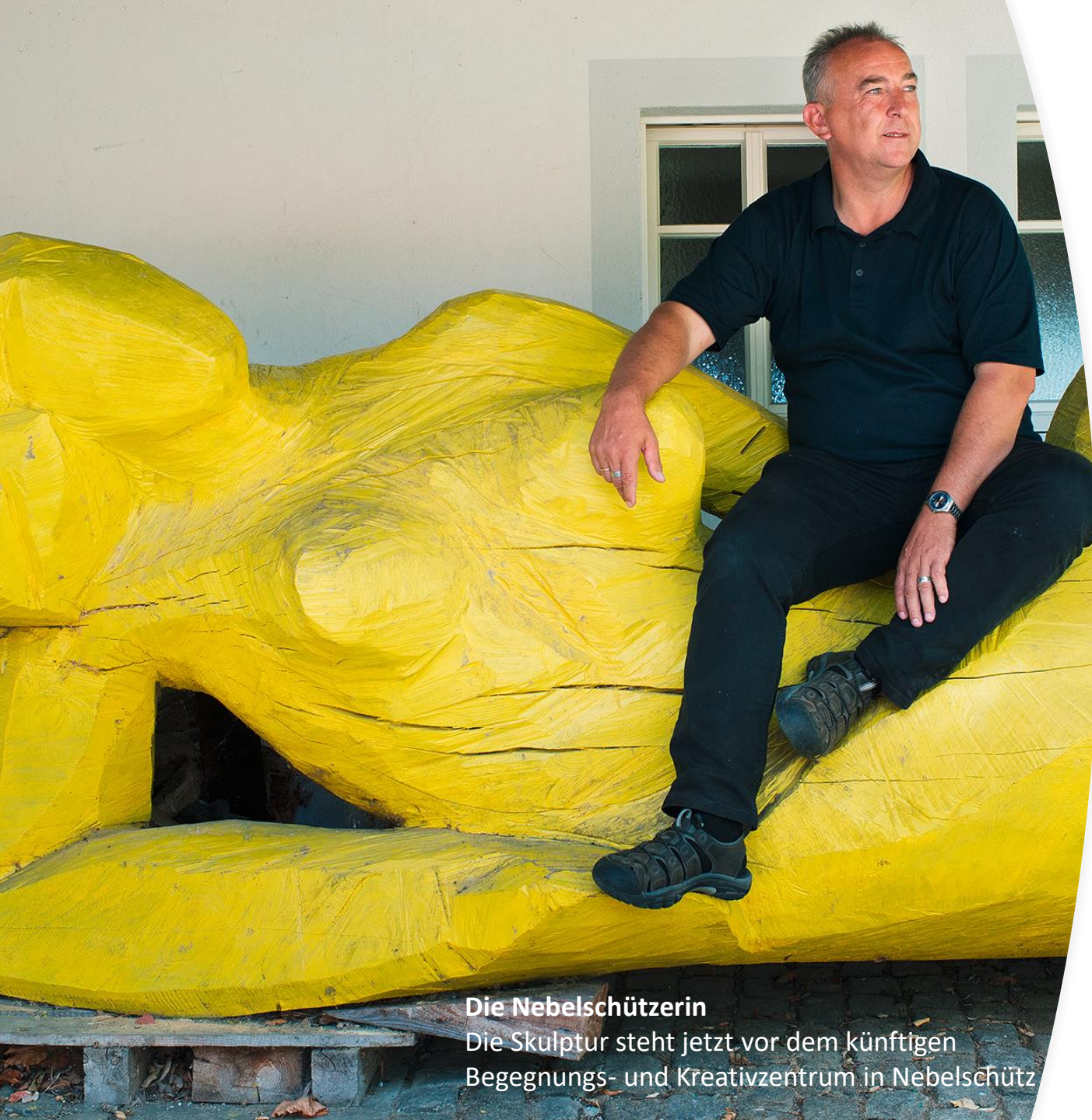
Die Nebelschützerin Die Skulptur steht jetzt vor dem künftigen Begegnungs- und Kreativzentrum in Nebelschütz