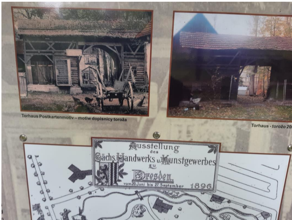
Torhaus Postkartenmotiv – motiw dopisnicy toroža